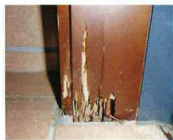
シロアリ被害状況

建物の基礎土台の木材や木柱などに被害がでると、大がかり修繕が必要になり費用も高額になってきます。早めの予防が大切です。