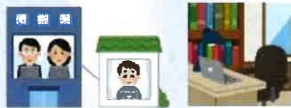
又は 間仕切り壁等の新設