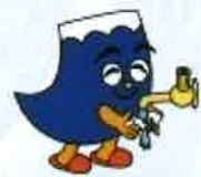
感染予防・家事負担軽減