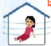
換気・省エネ など